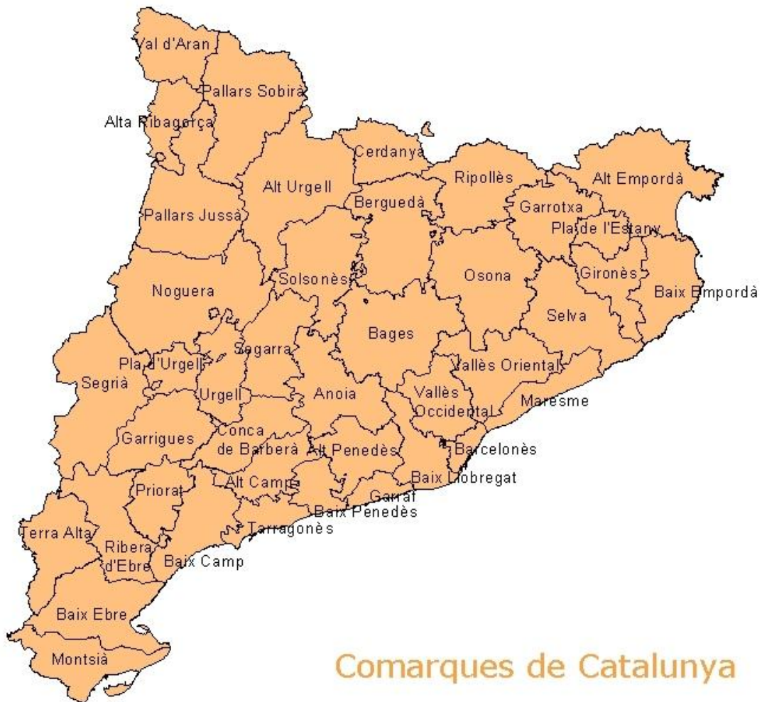
Comarques de Catalunya